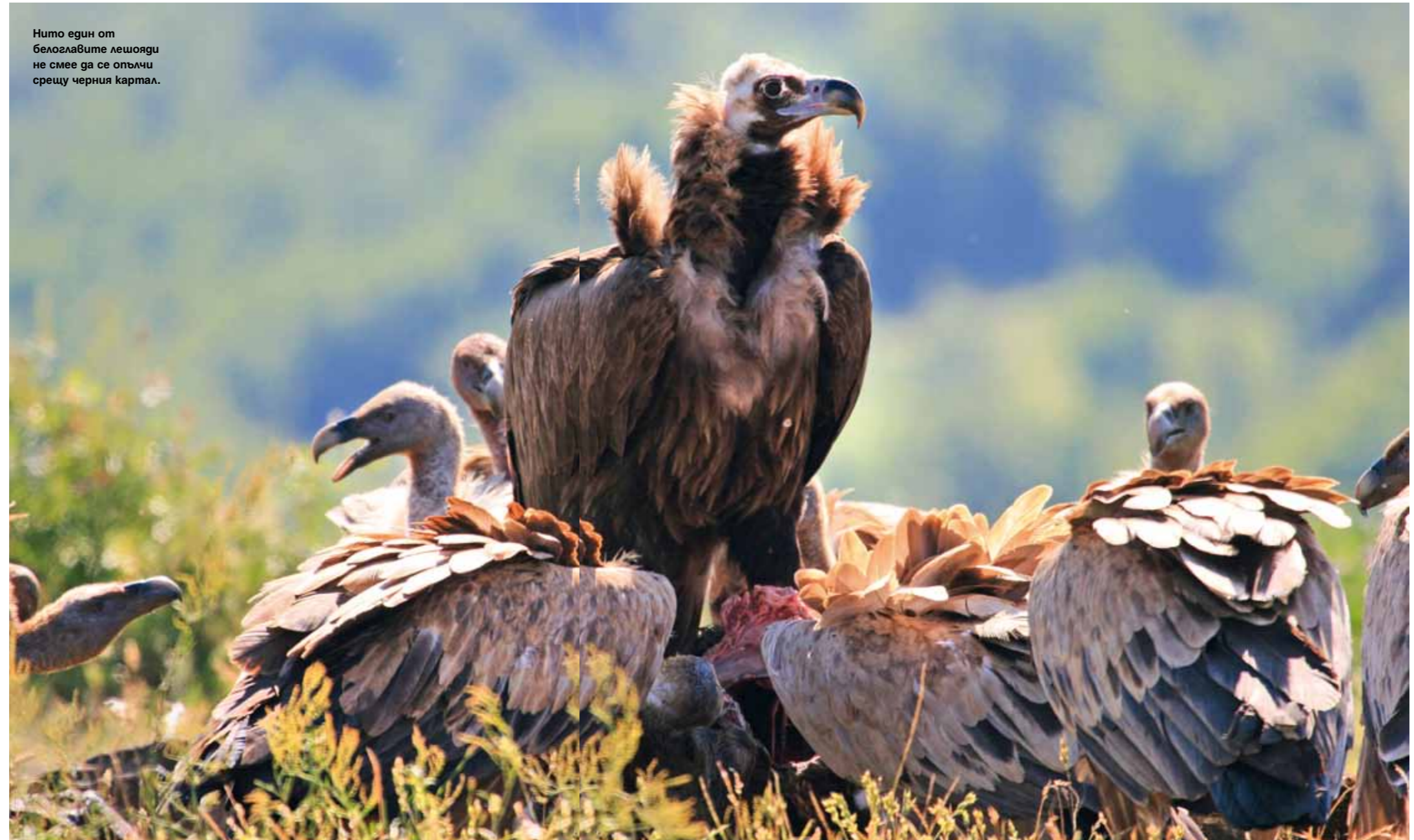
Нито един от белоглавите лешояди не смее да се опълчи срещу черния картал.

По бреговете на язовира сутрин минават елени лопатарци, за да утолят жаждата си, а на залез черните щъркели с тюркоазени шиш, червени човки и крака прелитат на 10 метра от лодката, успоредно