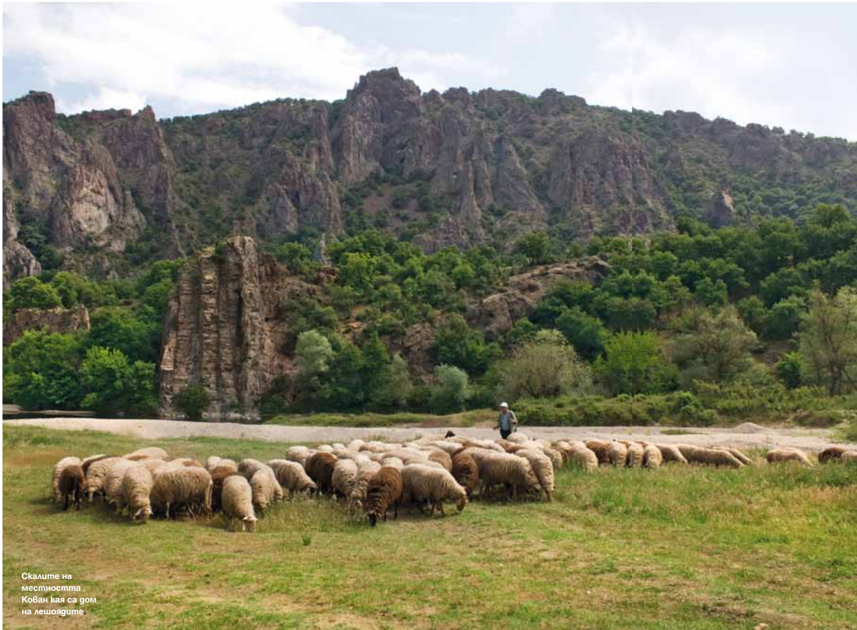
Скалите на местността Кован кая са дом на лешоядите.