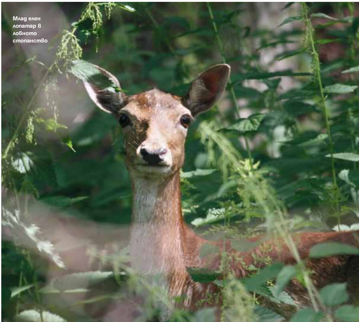
Млад елен лопатар в ловното стопанство

– пчелицата, Венерината пантофка и гр. В Източните Рогопи се наблюдават цели 16 вида. Въобще биоразнообразието е неповторимо. Срещаме холандски туристи, потресени от прежи-